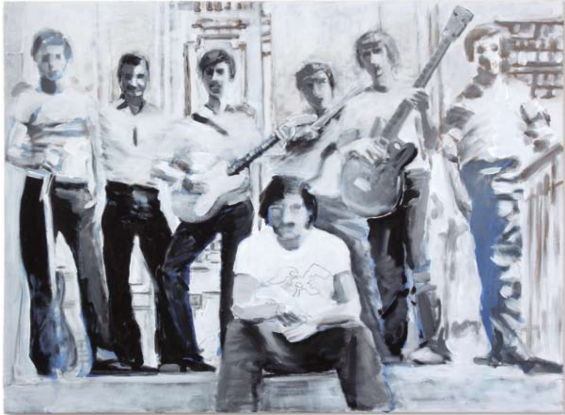
BAND „NOTE“, KULTURZENTRUM AKHALKALAKI, 1980 ACRYL/LEINWAND, 60X80CM, 2010